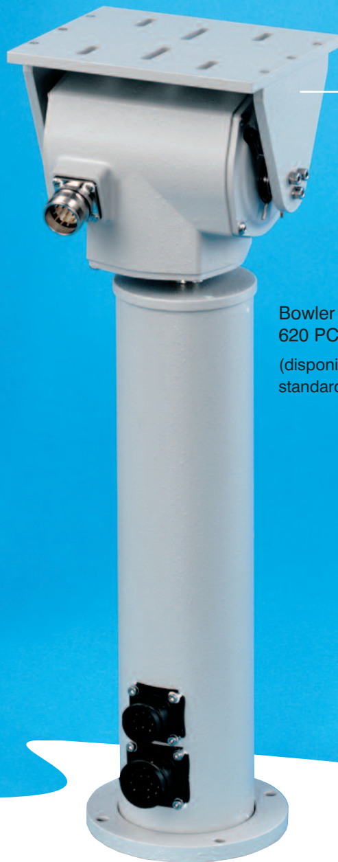
Bowler 620 PCR (disponible avec pylône standard ou court)