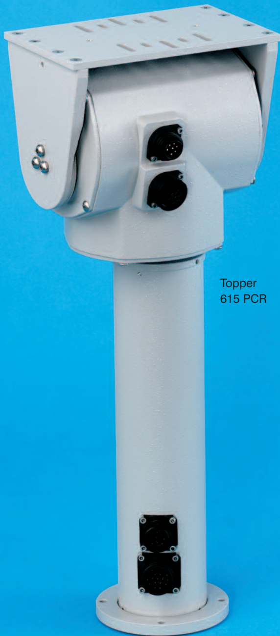
Topper 615 PCR