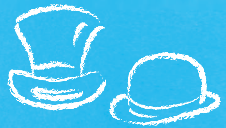
Tourelles universelles à rotation continue Topper et Bowler

Construction légère et résistante Haute fiabilité avec jeu minimal